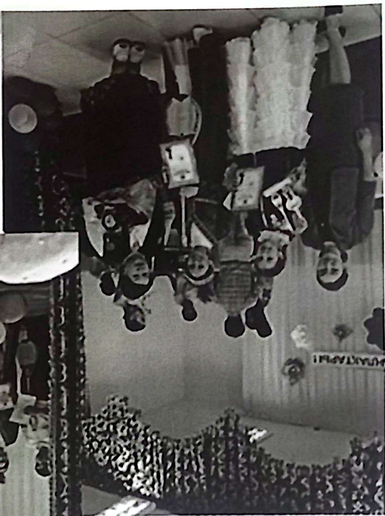
Жас акындар айтысы