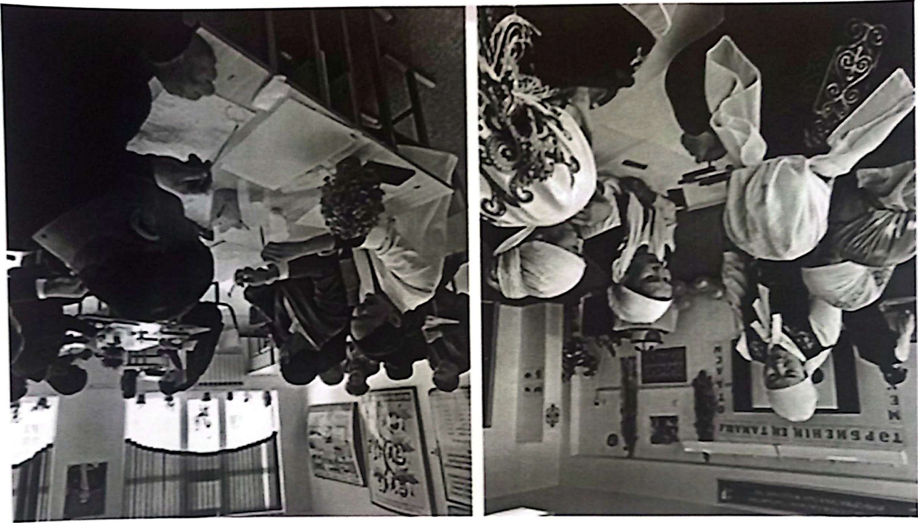
«Ұлттық құндылықтар – тәрбие негізі» Аймақтық семинар